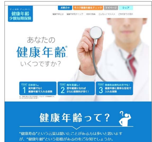
『健康年齢連動型医療保険』サイト(イメージ)

保険金額は、入院日数に関係なく、日帰り入院でも 80 万円をお支払いします。また、持病をお持ちの方でも過去 1 年間に 5 大生活習慣病で治療のために入院していなければ（もしくは入院を勧められていなければ）保険にご加入いただけます。なお、加入年齢範囲は実年齢で 18 歳～75 歳までとなります。